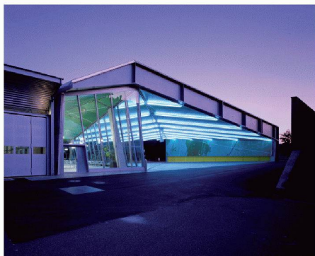
Buserminal Twerenbold, Baden