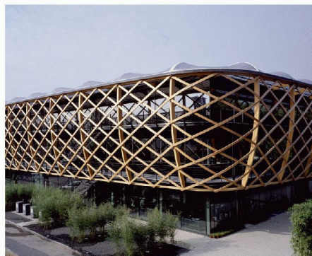
Hugo Boss Competence Center, Coldrerio