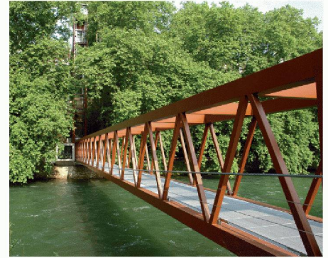
Limmatsteg, Baden/Ennetbaden