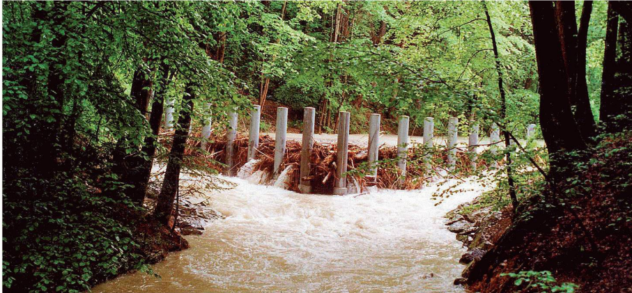
01 Chämptnerbach in Wetzikon Kempten: Der 1997 gebaute, V-förmige Schwemmholtzrechen hat sich bei den Hochwassern von 1999, 2005 und 2007 bewährt

Bei Hochwasser ist Schwemmholtz oft ein Problem. An einer Tagung in Zürich wurden verschiedene Lösungsansätze aufgezeigt.