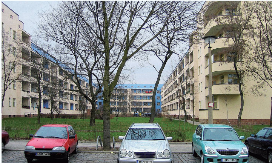
01 Wer wohnt im Weltkulturerbe? In der renovierten Wohnstadt Carl Legien (Bruno Taut 1928–30) hat der Bezirk Berlin Pankow für Mieterschutz gesorgt

Sechs Berliner Wohnsiedlungen aus den 1920er-Jahren kandidieren für die Unesco-Welterbeliste. Eine Ausstellung im Bauhaus-Archiv Berlin und ein opulenter Katalog stellen sie vor.