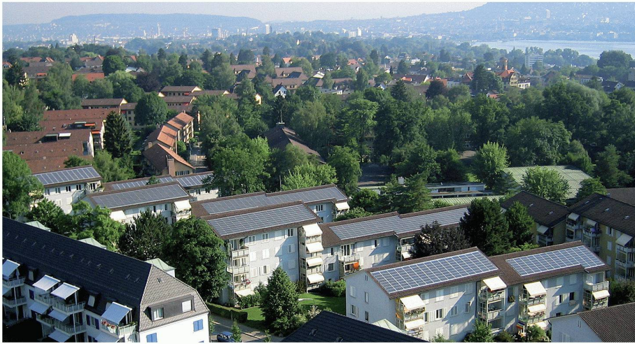
01 Strom von den Dächern einer Zürcher Baugenossenschaft

Sonnenkollektoren und Fotovoltaik-Module können teilweise auch in engen städtischen Verhältnissen platziert werden. Eine dreidimensionale Simulation erlaubt, die jeweiligen Möglichkeiten abzuschätzen.