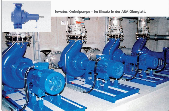
Sewatec Kreiselpumpe – im Einsatz in der ARA Oberglatt.

Hochbauamt Lämmlibrunnenstrasse 54, 9001 St.Gallen Telefon 071 229 30 17, Fax 071 229 39 94