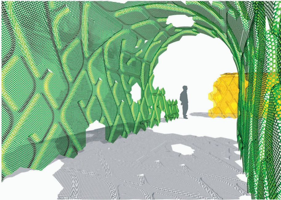
01 Werner Aisslinger: Mesh – Modular Knitting Structure. Für die Ausstellung Nature Design, Museum für Gestaltung Zürich, 2007. Modularer Hightech-Strick aus Kunstfaser (Werner Aisslinger, De-Berlin, Engineering: Visiotex, De-Neu-Ulm)