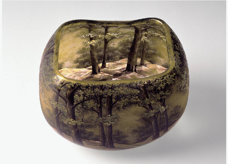
04 Daum Frères: Kleine Schüssel mit Laubwald, 1908. Farbloses Glas mit Flachfarbenmalerei; Museum für Gestaltung Zürich, Kunstgewerbesammlung

auch ihre Ingredienzen nicht immer aus der Natur stammen, so ist sie doch Inspiration und Herausforderung. Die Duftbibliothek von Christopher Brosius und Christopher Gable enthält denn auch nicht nur Wohlgerüche wie «Bambus», «Linden» oder «Gras», sondern auch Düfte wie «Regenwurm», «Dreck» oder «Schnee». Und die Nase bestätigt das Talent der Nachschöpfer. «Schnee» riecht nach nassem Moos, feuchter Erde und auf einer Handfläche geschmolzenen Eiskristallen. Passend zu dieser unsichtbaren Welt der Düfte ist auch die Geräuschkulisse in der Ausstellung: Ganz hinten im Raum hört man eine Quelle plätschern. Beim Herantreten entpuppt sich das Bächlein als ein Haufen durrer Buchenblätter, die von vier Ventilatoren in einem Zylinder aufgewirbelt und herumgeschoben werden. Der Landschaftsarchitekt Günther Vogt führt mit seiner die Sinne verwirrenden und schärfenden Installation an eine Wahrnehmung von Natur heran, die das ausschliesslich Visuelle übersteigt.