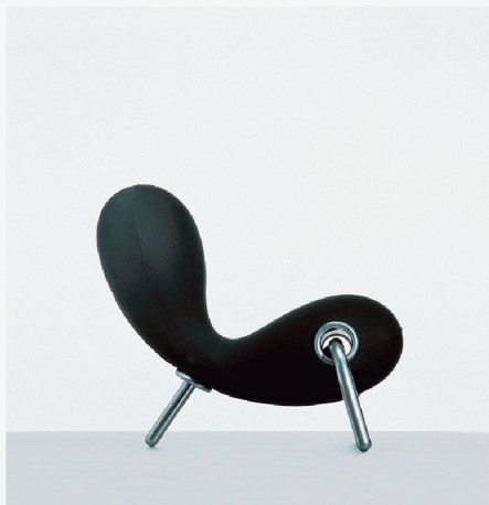
03 Marc Newson: Embryo Chair, 1988. Stahlrohr, Polyurethan, Neopren (Cappellini, I-Arosio)

Fast der ganzen Reihe von Designobjekten und Architekturen eigen ist die rein formale Ebene der Beschäftigung mit der Natur als Vorbild. Dagegen sind nur wenige – aber sehr interessante – Beispiele für die Beschäftigung mit abstrakteren Aspekten der Naturwahrnehmung, zum Beispiel inneren Prinzipien natürlicher Erscheinungen, in der Ausstellung vertreten. Einige beschäftigen sich mit dem Verhältnis von Mensch und Umwelt: So generiert beispielsweise das Pariser Architekturbüro R&Sie(n) eine Fassade aus der Luftverschmutzung. Für Bangkok schlagen sie ein Museum vor, dessen Aussenhülle elektrostatisch aufgeladen ist und sich so nach und nach mit den Staubpartikeln aus der verschmutzten Luft verhüllt. Wie riecht Schnee? Sehr überraschend und bereichernd wirkt in der Ausstellung das Thema Duft. Parfums können als eine zwar ephemere, aber umso intensivere Beschäftigung mit Natur gedeutet werden. Wenn