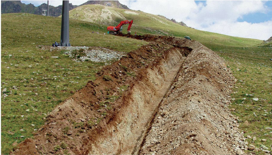
01 Werden die Umweltauflagen bereits in einer frühen Phase des Bauprojektes einbezogen, erleichtert das die Umsetzung. Im Bild: Erstellung einer Beschneidungsleitung in Suvretta / St. Moritz

Ende Juni 2007 fand in Sursee das erste «Forum Umweltbaubegleitung» statt. Dabei gab es unter den verschiedenen Interessengruppen einen breiten Konsens für die Weiterentwicklung des Instruments Umweltbaubegleitung in Richtung Erfolgskontrolle. Viele Haftungs- und methodologische Fragen müssen aber noch geklärt werden.