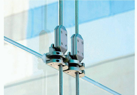
Du Pont de Nemours (Deutschland) GmbH D-61343 Bad Homburg | de.news.dupont.com

gen ist auch deren gute Haftung an Metall entscheidend für die Stabilität der Fassade. Dadurch lassen sich die Lasten hocheffizient auf die sehr klein ausgeführten Punkthalterungen aus Stahl übertragen. Aufgrund ihrer geringen Grösse bietet die Aussenhaut der Fassade ein nahezu durchgängiges Erscheinungsbild, das nicht durch Bohrungen oder Befestigungselemente gestört wird. Zudem sorgen die SentryGlas-Plus-Zwischenlagen für eine sehr hohe Resttragfähigkeit der Fassadenelemente nach einem Bruch des Glases. Der Wartungsaufwand ist gering.