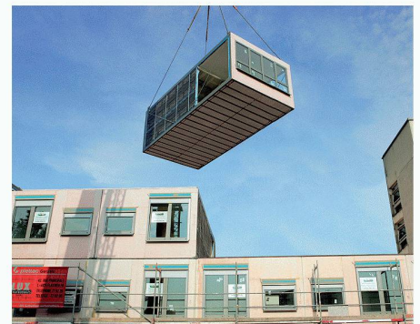
ALHO AG | 4806 Wikon www.alho.ch

Bereits bei der Planung stehen alle relevanten Gebäudeinformationen zur Verfügung. In alle gängigen FM-Systeme integrierbar helfen sie, die Kosten zu optimieren. Die Mobilität der Immobilien erhöht zusätzlich deren Nutzwert – über Jahrzehnte hinweg.