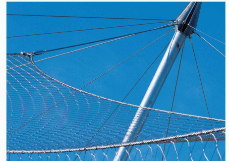
Carl Stahl AG | 8854 Siebnen www.carlstahl.com

Tiergehege wie das neue Gehege für die Persischen Leoparden im Berner Tierpark Dählhölzli gehören zur Leidenschaft der X-TEND-Architekten und insbesondere des Stuttgarter Ingenieurbüros Officium Design Engineering GmbH. Grosse Spannweiten sind berechenbar und werden in fantasievolle Formen aus Seilen und Stahlstützen umgesetzt. Konstruktionen aus X-TEND sind grosszügig für viel Bewegungsraum, transparent für den barrierefreien Blick und dauerhaft.