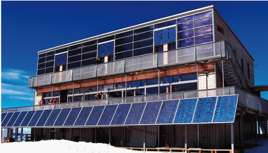
Dank Sonnenkollektoren und Fotovoltaikanlage, Regenwassergewinnung und biologischer Abwasserreinigung ist die Schutzhütte Schiestlhaus (Steiermark) völlig autark (Bild: Treberspung & Partner Architekten)

In einem Wissenstransferprojekt hat die Internationale Alpenschutzkommission, Cipro, alpenweites Erfahrungswissen zu Projekten gesammelt, die Naturschutz, Bedürfnisse der Bevölkerung und wirtschaftliche Ziele in Einklang bringen. Dieses Wissen steht nun allen Interessierten zur Verfügung und soll Impulse für eine nachhaltige Entwicklung in den Alpen geben.