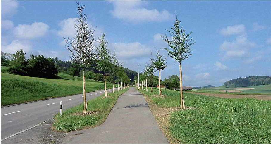
01 Neue Allee an der Kantonsstrasse in Wängi. Die Thurgauer Gemeinde hat die Alleen-Kampagne genutzt, um ihre Dorfeinfahrten aufzuwerten

Im Jahr 2006 startete der Fonds Landschaft Schweiz (FLS), der sich der Erhaltung und Aufwertung naturnaher Kulturlandschaften verschrieben hat, eine Alleen-Kampagne. 1 Damit will er landschaftsprägende und ökologisch wertvolle Alleen und Baumreihen fördern.