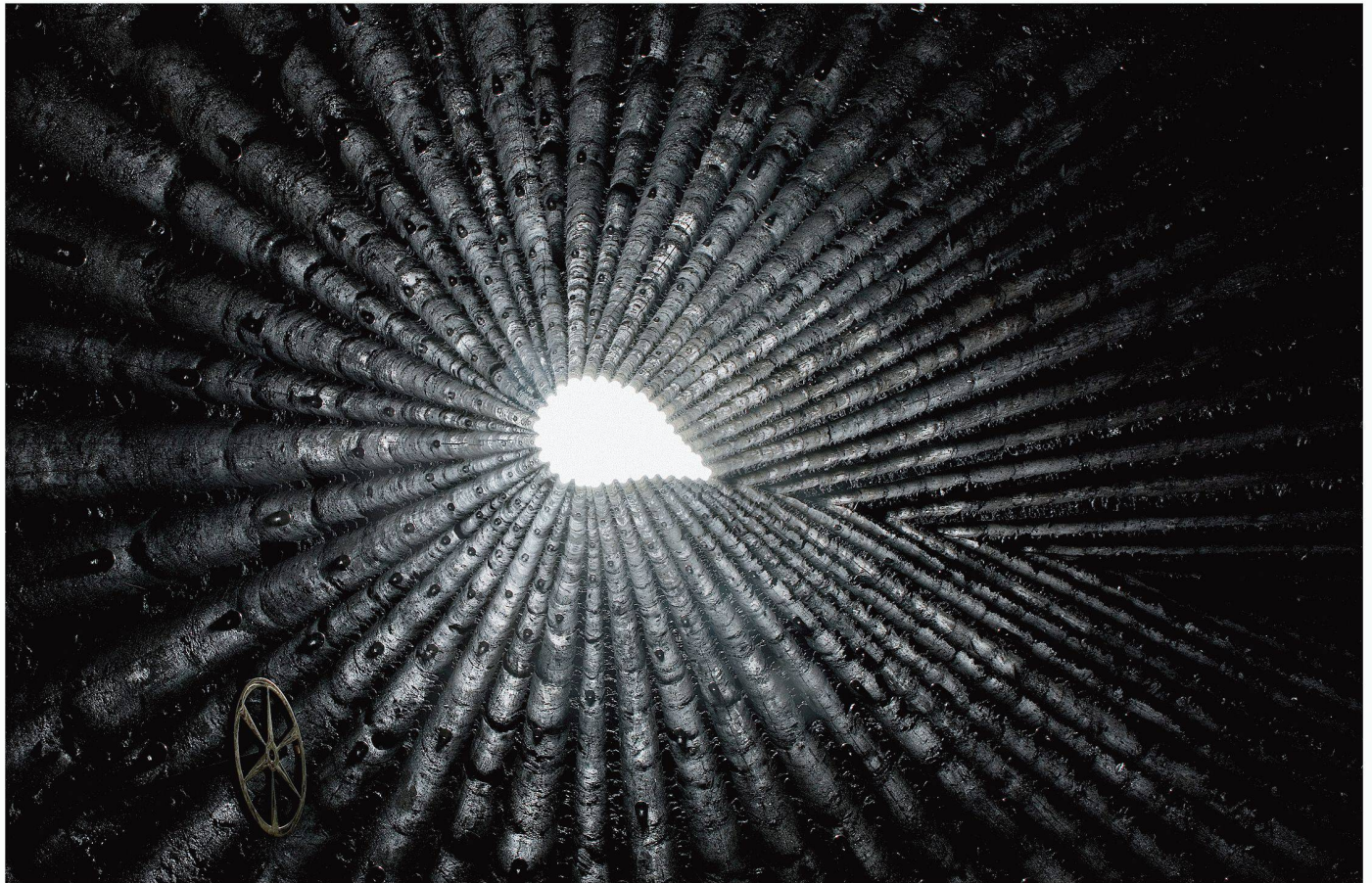
02 Die 112 Fichtenstämme zeichnen sich nach der «Ausräucherung» im Innern ab. Der Blick zum tropfenförmigen Okulus streicht über das Meditationsrad aus poliertem Messing

Der Raum ist nicht gross, aber grossartig in seiner Wirkung. Die dreieckige Türöffnung setzt sich als niedriger Gang fort und geht nahtlos in den Hauptraum über, der 12 Meter in die Höhe ragt. Man findet sich umgeben von den russgeschwärzten Abdrücken vieler Baumstämme im Beton, die die räumliche Perspektive gen Himmel verstärken. Sie enden in einem tropfenförmigen Okulus – zusammen mit dem Eingangstunnel die einzige Lichtquelle. Es riecht nach dem Rauch des Holzfeuers, das aber – ebenso wie die Baumstammenschalung – nur noch als sinnliches Echo vorhanden ist.