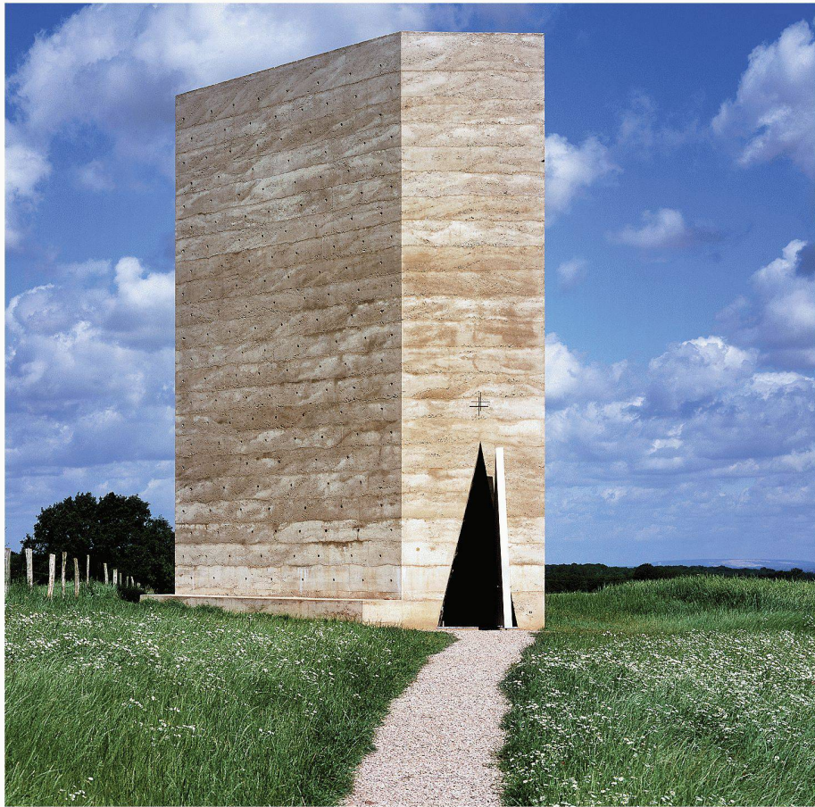
01 Das unregelmässige Prisma wirkt je nach Blickpunkt wie eine Stele, wie ein in den Himmel schneidendes Schwert oder wie eine seltsam flache Mauer auf der Wiese

Selbstbewusst steht sie da, Peter Zumthors Bruder-Klaus-Kapelle im Weiler Mechernich-Wachendorf in der Eifel: Als Turm in der Landschaft überhöht sie eine sanfte Hügelkuppe vor dem Hintergrund eines dunklen Waldsaums.