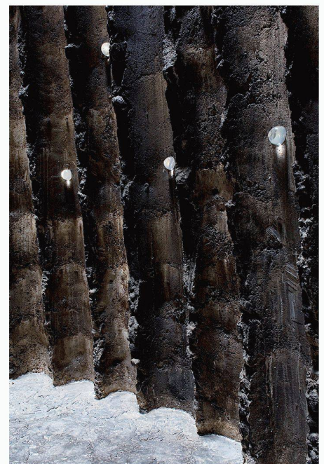
03 Die Bundöffnungen sind mit mundgeblasenen Glaspfropfen verschlossen

Leider belies es Zumthor nicht bei der Wirkung dieses Zauberraumes. In einer Ausbuchtung stehen ein Sandbehälter, der als Kerzenständer dient, und ein Opferstock aus Chromstahl, eine knapp einen Meter breite Sitzbank aus Lindenholz mit Chromstahlbei-