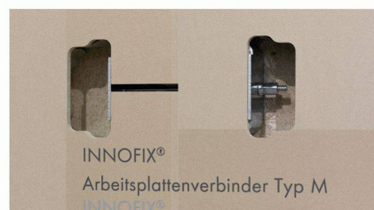
Ergänzt das Arbeitsplattenzubehörprogramm: Der neue Innofix-Arbeitsplattenverbinder Typ M.