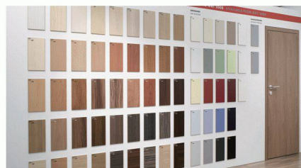
Bei der ZOW 2008 stellte EGGER erstmals die Dekore seiner neuen Schichtstoff-Türenkollektion vor.