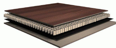
Die neuen ProAkustik-light-Platten, hier in der Ausführung für Möbelplatten mit Decklagen aus einem 3 mm starken Verbundelement aus MDF-Platten und Schichtstoff.