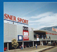
Media Markt, Conthey