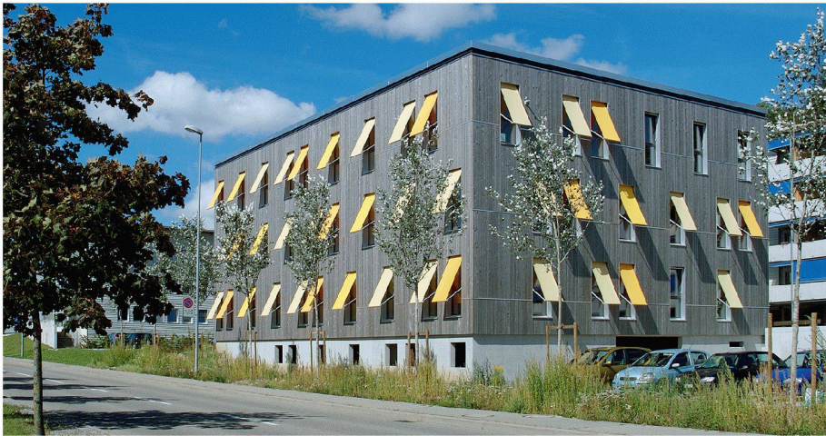
01 Das mit dem Minergie-P-Eco-Label ausgezeichnete Bürogebäude «Green Offices» in Givisiez FR (Architekt: Conrad Lutz) besteht grösstenteils aus lokalem Holz, um die Graue Energie zu minimieren

Das Gebäudelabel Minergie-Eco für eine gesunde und ökologische Bauweise wurde Mitte 2006 auf dem Markt eingeführt. Die bisherigen Erfahrungen sind positiv. Der Fragenkatalog wurde daher nur leicht überarbeitet. Geplant ist ausserdem eine Ausweitung auf Einfamilienhäuser und Sanierungen.