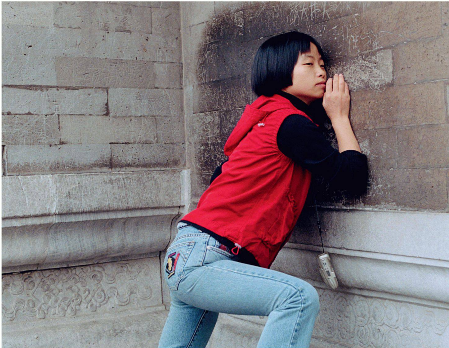
Peking, Himmelstempel. Eine junge Frau lauscht den Stimmen an der Echomauer, die die Halle des Himmelsgewölbes umgibt

Vom 1. bis 5. Juli findet in Berlin das Festival «Tuned City» statt. Im Januar 2008 organisierten die Veranstalter das Preview-Symposium als theoretische Einstimmung mit dem Ziel, einen Dialog zwischen planenden Fachleuten und Soundkünstlern zu generieren.