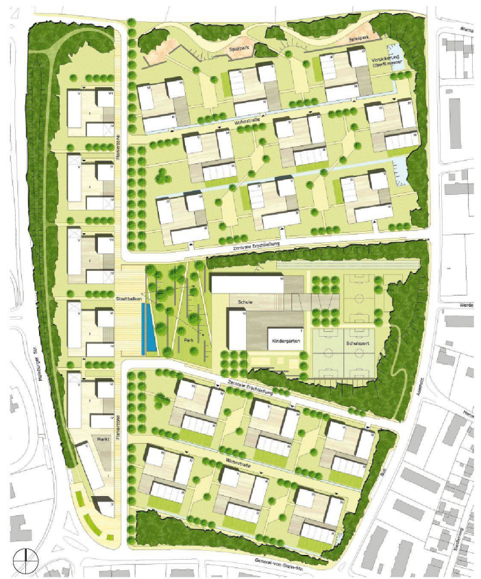
02 2. Preis: Björn Severin Rheinflügel, D-Düsseldorf; bK - büroKleinekort, D-Düsseldorf; Büro Verhas, Landschaftsarchitektur, D-Düsseldorf

Für die Überbauung einer ehemaligen Kasernenanlage im bayrischen Freising forderte die Stadt eine verdichtete und für die Solarenergienutzung optimierte Planung. Priska Ammann und Martin Albers aus Zürich setzten sich im Wettbewerb mit ihrem Entwurf durch.