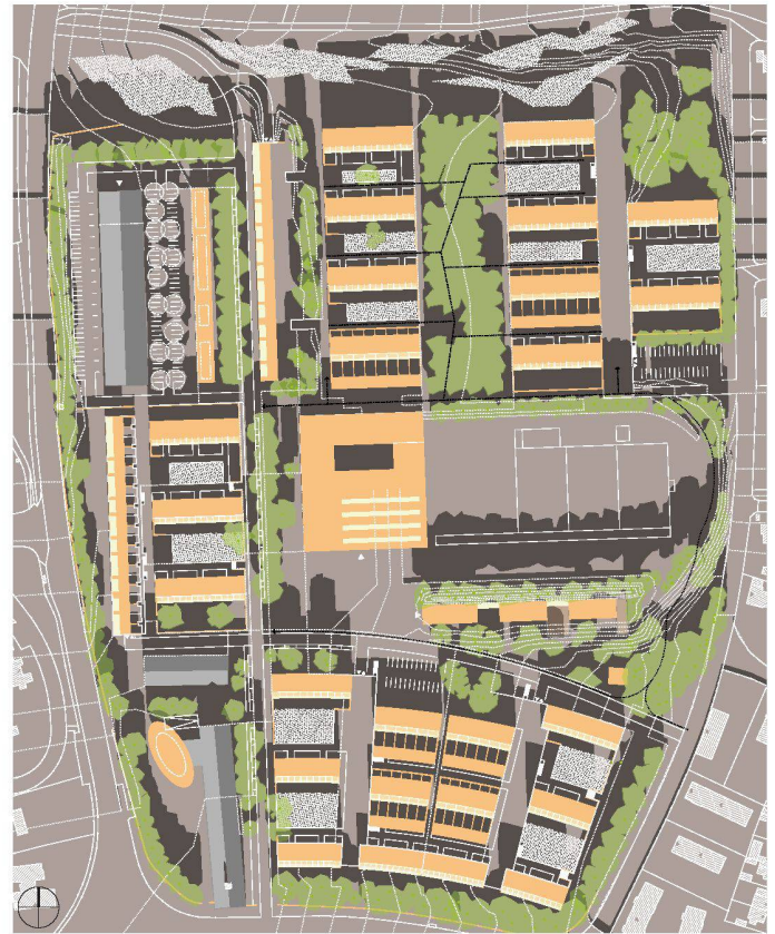
04 4. Preis: Maurer Frick Architekten, D-München; Gerrit Stahr, Landschaftsarchitekt, D-München