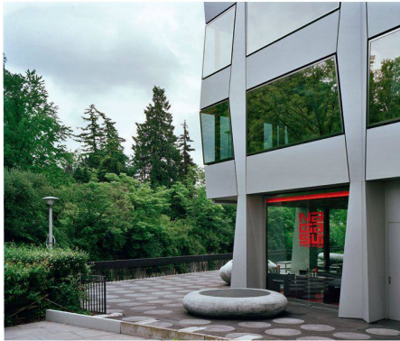
04 Die Belüftung der Tiefgarage ist ebenfalls in einem Betonelement untergebracht