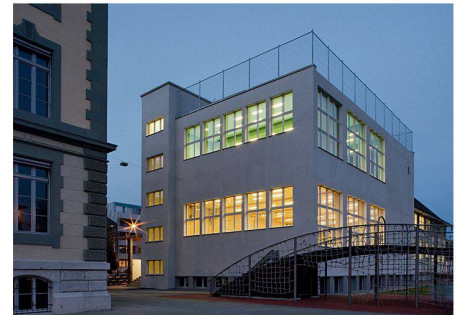
01 Sporthalle Neumarkt in Biel von 1932, saniert 2007 durch Spaceshop Architekten, Biel: Energetische Sanierung und denkmalpflegerische Ansprüche schlossen einander nicht aus

Einen wichtigen Teil der Tagung nahm das Thema Minergie ein. Ein Überblick zeigte, dass Minergiestandards auch für Sporthallen längst keine Ausnahme mehr darstellen. Am Beispiel der Sporthalle Altikofen in Ittigen aus den 1970er-Jahren (Umbau und Sanierung: Sylvia und Kurt Schenk Architekten, Bern, 2003) wurden die Schwierigkeiten angesprochen, die es zu überwinden galt, um bei einem Bau aus dieser Zeit die Minergiestandards erreichen zu können. Daneben wurde deutlich, dass eine Sanierung nicht nur den Gebrauchswert erhöht, sondern auch die architektonische Qualität positiv beeinflussen kann. Im Fall der von Spaceshop Architekten, Biel, sanierten Sporthalle Neumarkt aus der Zeit der Bieler Moderne hat die Anpassung des Raumprogramms und das Erreichen der Minergiestandards nicht nur den Erhalt des Gebäudes ermöglicht: Der Umbau genügt auch denkmalpflegerischen Ansprüchen.