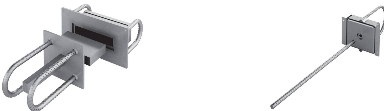
Abbildung 1: CRET Silent-980 (links) und RIBA Silent-912 (rechts)

Basierend auf den Ergebnissen der Vorversuche wurde die Ausgestaltung der neuen Kraftübertragungselemente in Angriff genommen. Da die neuen Isolationsmaterialien weicher als Neopren sind, musste unter anderem die Auflagefläche vergrössert werden. Dies führte zum neuen Design der Elemente CRET® Silent-980, -981 und RIBA Silent-912, -914 (Abb. 1).