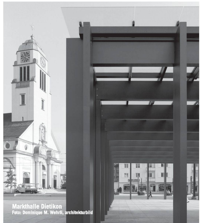
Markthalle Dietikon

Preis und Leistung stehen bei uns täglich im Mittelpunkt. Geringere Kosten bedeuten nicht automatisch weniger Qualität oder mangelnde Flexibilität. Fragen Sie uns an.