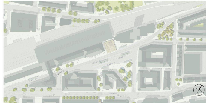
01+02 Siegerprojekt «Akari»: Nachts erstrahlen die bedruckten Glasfassaden der grossen Laterne, die Tagwirkung ist hingegen weniger stark