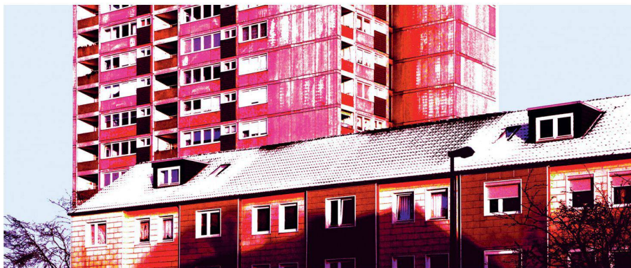
01 Statt in die Breite ist die Verdichtung in die dritte Dimension – die Erweiterung bestehenden Wohnraums durch Aufstocken und Ergänzungsbauten mittels Hochhäusern – eine Alternative

Der Titel der Tagung des ETH Wohnforums, die Ende April in Zürich stattfand, weckte Erwartungen: «Hoch hinaus oder in die Breite?» Oder: Welche Lebensformen, wirtschaftlichen Effekte und ökologischen Implikationen bringen diese Siedlungsformen mit sich? Die zum Teil provokanten Referate präsentierten einen grossen Teil des aktuellen Wissens, doch es blieben auch Fragen offen.