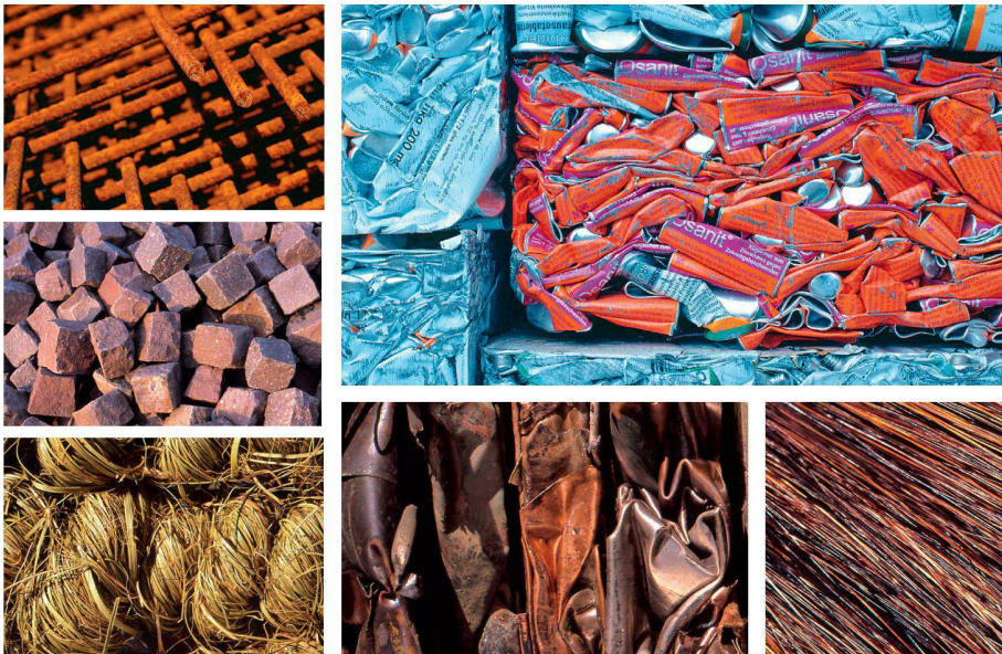
01 Vielfalt des Materials: Armierungsstahl, Pflastersteine, Fasern, Bleche, Tierhaare und Aluminium (im Gegenuhrzeigersinn von links oben)

Ende vergangenen Februar wurde die neue Onlinedatenbank «Material Archiv» aufgeschaltet. Das Portal ist ein Zusammenschluss mehrerer Deutschschweizer Materialdatenbanken. Komplettiert wird das Angebot durch die gleichnamige permanente Ausstellung im Gewerbemuseum Winterthur, die seit dem 4. April zu sehen ist.