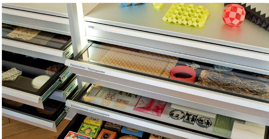
02 Die physischen Sammlungen erlauben die direkte Auseinandersetzung mit dem Werkstoff – in diesem Fall Papier

Das Gewerbemuseum Winterthur präsentierte mit «Materialgeschichten» bereits 2001 eine Ausstellung zum Thema. Die aktuelle Schau «Material Archiv» baut auf der daraus entstandenen Materialbibliothek auf. Die gezeigten Muster sind mit RFID(Radio-Frequenz-Identifikations)-Etiketten ausgestattet. Mittels Materialscannern, vergleichbar mit der kontaktlosen Registrierung bei der Bücherausleihe, kann das Etikett eines Werkstoffes eingelesen werden. Durch die Verknüpfung mit der digitalen Datenbank erhält der Nutzer zusätzliche Informationen zum jeweiligen Exponat. Neben den zwölf Arbeitsplätzen mit Materialscannern stehen Experimentierstationen, eine Fachbibliothek und Filme zur Verfügung. Das Nebeneinander von «realem» Produkt und virtueller Information erlaubt es, die Eigenschaften verschiedener Werkstoffe sowohl auf technische als auch auf ästhetische und sinnliche Kriterien hin zu untersuchen und zu vergleichen.