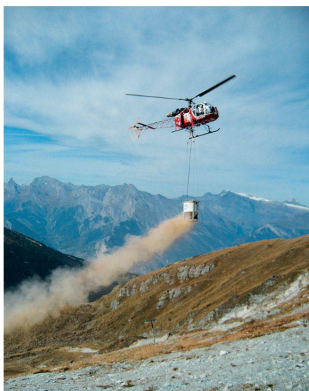
01 Die neue Richtlinie Hochlagenbegrünung soll die Qualität von Rekultivierungen im alpinen Raum erhöhen. Im Bild: Helikopter mit Saatgerät