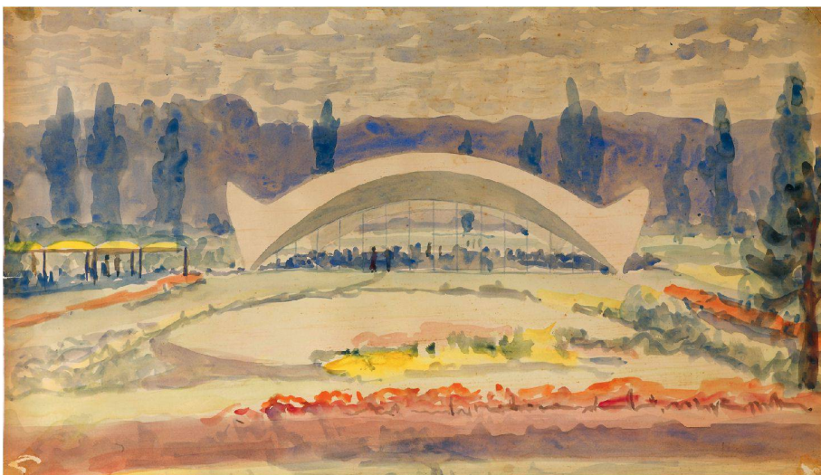
02 Gartencenter Wyss in Zuzwil (SO), Entwurf 1962 (Aquarell: Archiv Heinz Bösigler)