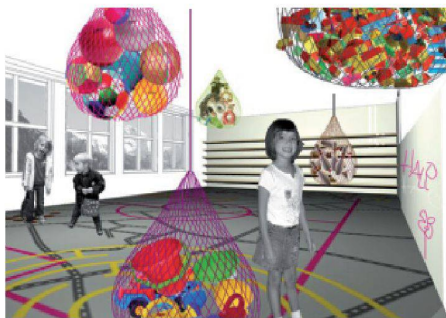
01 Siegerprojekt «Spielbox» (Visualisierung: Heike Heldt)