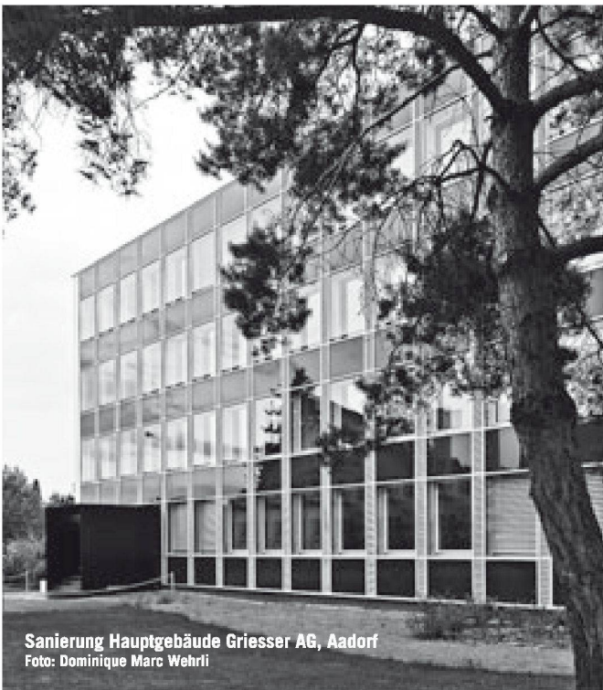
Sanierung Hauptgebäude Griesser AG, Aadorf

Partner für anspruchsvolle Projekte in Stahl und Glas