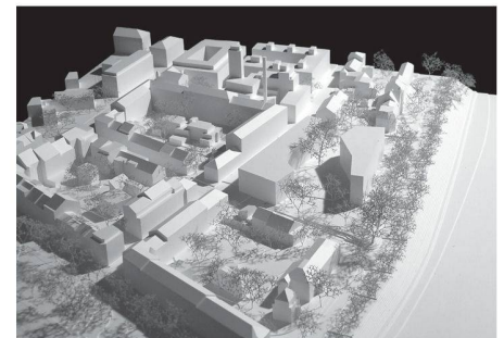
10 «Louise»: Klare Gebäudefluchten im Norden und im Süden