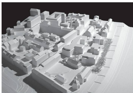
05 «Äpfel der Hesperiden»: Öffentliche Raumfolge am Burgweg

henen Materialisierung gefordert. Weiter wurden in den Erläuterungen Aussagen zur Materialisierung, zur Energieeffizienz (Miergie-P), zur Wirtschaftlichkeit und zum Thema Nachhaltigkeit erwartet. Zur Bearbeitung der Aufgabe sollten zudem Fachplaner und Experten (Landschaftsarchitekt, Bauingenieur, Bauökonom etc.) beigezogen werden. Vorgegeben war ein detaillierter Wohnungsspiegel mit Angabe der Art, der Anzahl und der Grösse der einzelnen Miet- und Eigentumswohnungen. Mit diesen Anforderungen entspricht das Programm einem Projektwettbewerb mit dem Unterschied, dass im Ideenwettbewerb kein substantieller Auftrag für Planerleistungen in Aussicht gestellt wurde.