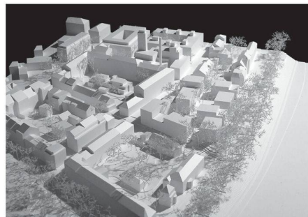
09 «Rheinweis»: Repräsentative Stadtvillen