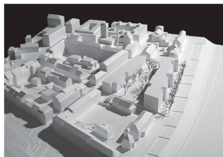
06 «Romeo und Julia»: Kontinuität im Städtebau