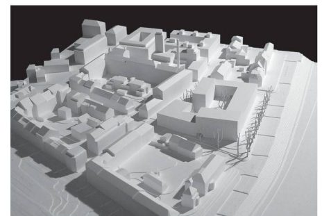
07 «Citizen»: Sozial integrativer Stadtteil