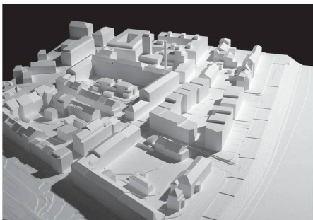
08 «Abbey Road»: Vermittlung zwischen Zeilenbau und Blockrand

Das erstplatzierte Projekt «riva» sieht vier kompakte Solitärbauten vor, mit denen die Kanten des Gevierts definiert werden und die gleichzeitig einen durchlässigen, parkähnlichen Freiraum zwischen Quartier und Rheinufer aufspannen. Die vorgeschlagene offene Bebauung bricht mit der tradierten geschlossenen Blockrandbebauung und schlägt ein Konzept vor, das die hybriden Bebauungsmuster des Quartiers auf verblüffende Art neu interpretiert. Geschickt wird die Allemannengasse zu einem Platz ausgeweitet, an dem quartierbezogene Nutzungen angelagert sind. Zum Rhein hin wird der Aussenraum privatisiert und zu den Wohnungen der zur Rheinpromenade orientierten Häusern geschlagen. Das Preisgericht würdigt die Flexibilität des gewählten Tragwerks mit innerem Kern und Stützen an der Fassade, kritisiert aber gleichzeitig die fehlende Speichermasse. Auch die umlaufende selbsttragende Balkonschicht sei funktional überzeugend, führe aber auch zu einer schematischen Uniformität der äusseren Erscheinung. Die holzverkleideten Fassaden evozieren ein Bild leichter Pavillons im Park, die jedoch mit fünf bis acht Geschossen einen städtischen Massstab etablieren. Inwieweit die vorgeschlagene öffentliche Durchgängigkeit des Areals die Intimität der Wohnnutzung einschränkt, wird die Zukunft weisen.