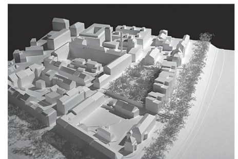
13 «... vorn die Ostsee, hinten die Friedrichstrasse ...»: Rheinblick für alle