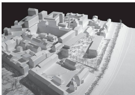
11 «Belagio»: Klare Baukörper, präzise Setzung