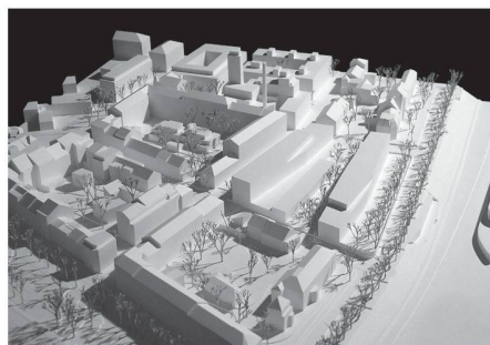
12 «lichtspiel»: Drei geschliffene Zeilen