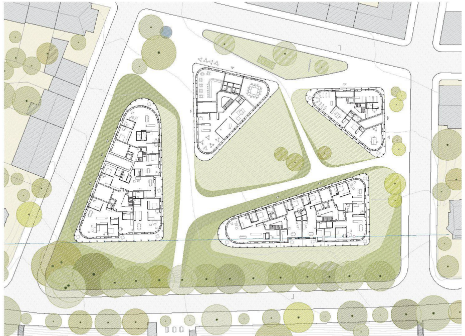
03 Siegerprojekt «riva»: Öffentlichkeit und Privatheit

Auf dem Areal des alten Basler Kinderspitals sollen in attraktiver Lage am Rhein Miet- und Eigentumswohnungen entstehen. Mit einem Ideenwettbewerb wurde ein qualitativ hochstehendes Projekt gesucht, das sowohl investorentauglich wie auch quartierfreundlich ist.