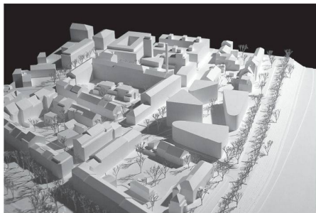
02 «riva»: Offene Bebauung definiert den Stadtraum