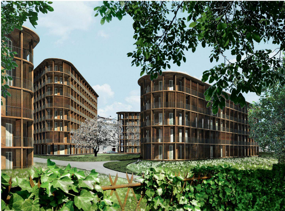
04 Siegerprojekt «riva»: Holzverkleidete Bauten mit städtischem Massstab (Plan und Visualisierung: Jessen + Vollenweider Architektur, Basel)