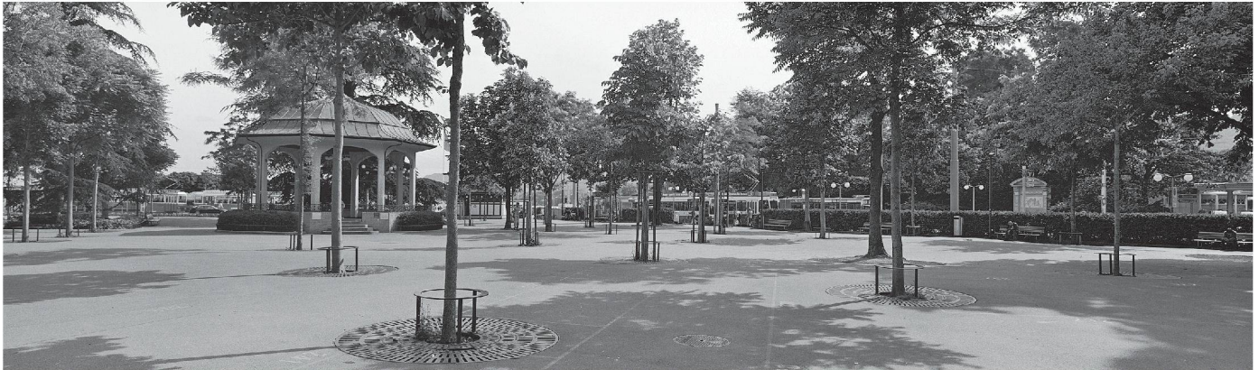
01 Robin Foster, Stadthausanlage Bürkliplatz (Foto: Robin Foster, Guido Hager, Architekturforum)

Die aktuelle Ausstellung des Architekturforums in Zürich thematisiert die Wechselwirkung zwischen gestalteter und gemalter Landschaft.