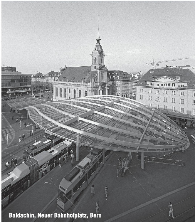
Baldachin, Neuer Bahnhofplatz, Bern

Partner für anspruchsvolle Projekte in Stahl und Glas