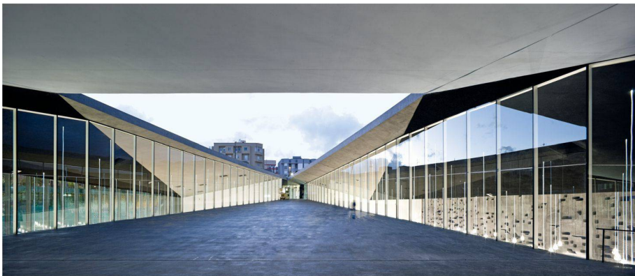
01 Tenerife Espacio de las Artes (TEA) im Stadtgefüge 02 Schneise durch den Baukörper

Herzog & de Meuron scheinen ihre Vorliebe ausgerechnet für die Sonneninsel Teneriffa entdeckt zu haben. Allein im Herbst 2008 wurden zwei wichtige Projekte der Basler Architekten in Santa Cruz de Tenerife fertig gestellt: die erste Phase der umfassenden Hafenumgestaltung und der unweit davon gelegene Tenerife Espacio de las Artes (TEA).