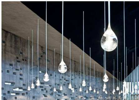
03 Die tropfenförmigen Lampen vor der Pixelfassade

Gran Canaria gleichzuziehen. Das Kulturzentrum sollte ursprünglich unter dem Namen «Instituto Oscar Domínguez» den Sammlungsbestand des kanarischen Surrealisten Oscar Domínguez präsentieren – mittlerweile fanden aber auch Werke von Man Ray und Germaine Krull, von Imi Knoebel und Jirí Georg Dokoupil Eingang in die Sammlung, die im zweiten Geschoss untergebracht ist.