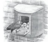
Systemstein (für Turmfalke, Dohle, Mauersegler)