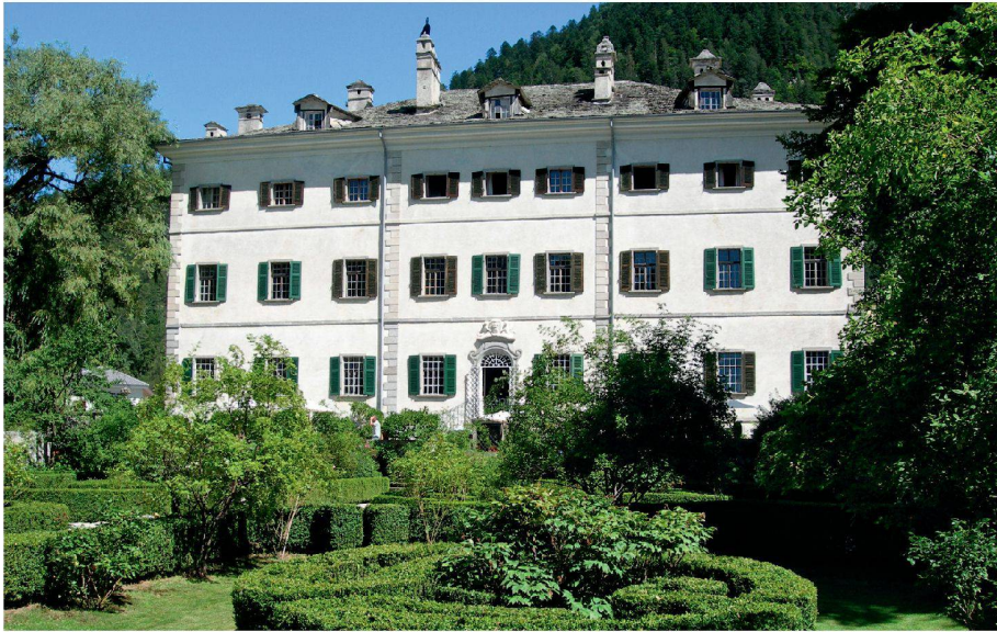
01 Garten des Palazzo Salis in Bondo mit dem Herrschaftshaus, das untrennbar mit dem Garten verbunden ist