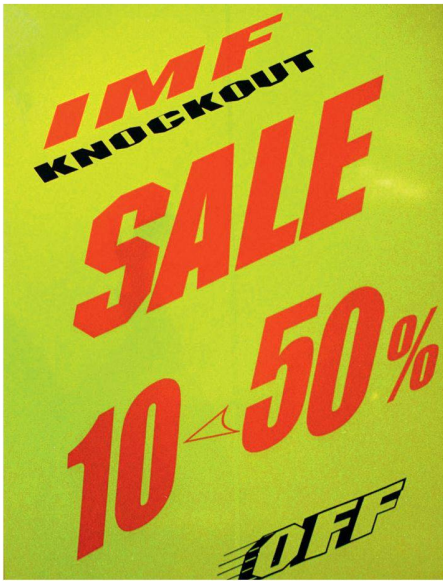
01 Tiefster Preis: gute Empfehlung für den Zuschlag?

In TEC21 9/2009, «Futterneid», ist ein Interview zum Thema Beschaffungswesen von Ingenieurleistungen erschienen. Der nachstehende Leserbrief hinterfragt und diskutiert einige ausgewählte Aussagen.