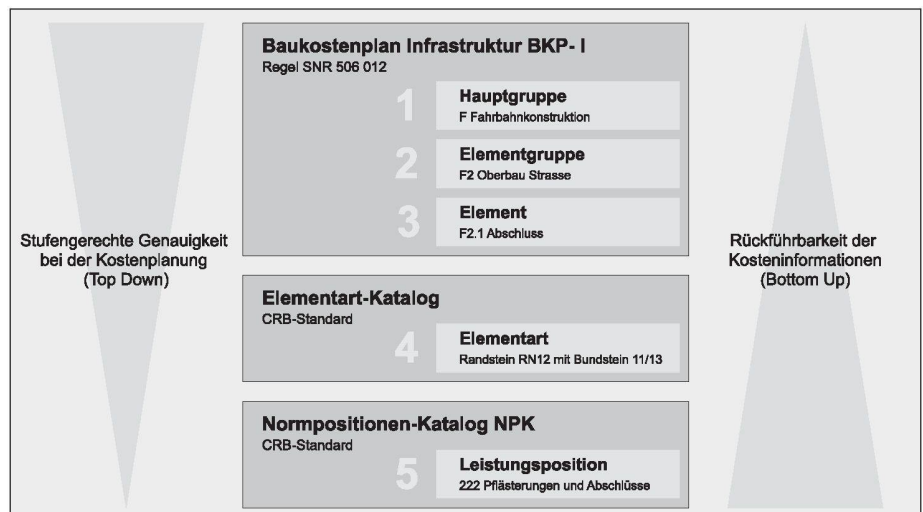
01 Die CRB-Arbeitsmittel sind durchgängig anwendbar und können mit Kennwerten hinterlegt werden

Leistungspositionen beinhalten kalkulierte Preise, die die Planer aus eigenen Projekten erheben oder die von Verbänden zur Verfügung gestellt werden. Diese Preise werden über die Elementarten zu Kennwerten verdichtet und eignen sich so für die Anwendung in frühen Projektphasen.