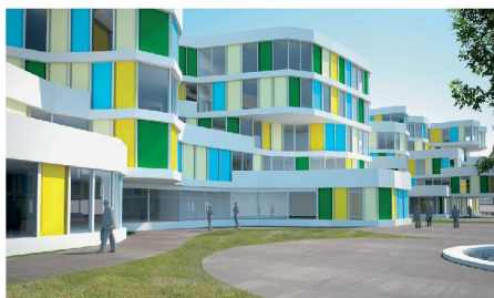
01 Wettbewerbsbeitrag Überbauung Kalkbreite (Visualisierung: SLIK Architekten)

In den letzten Jahren ist der architektonische Entwurfsprozess zunehmend digitaler geworden – und damit auch austauschbarer. Einen Beitrag zur Diskussion um Potenziale und Grenzen dieser Entwicklung leistet die Ausstellung «Präzision des Zufalls – Architekturautomaten».