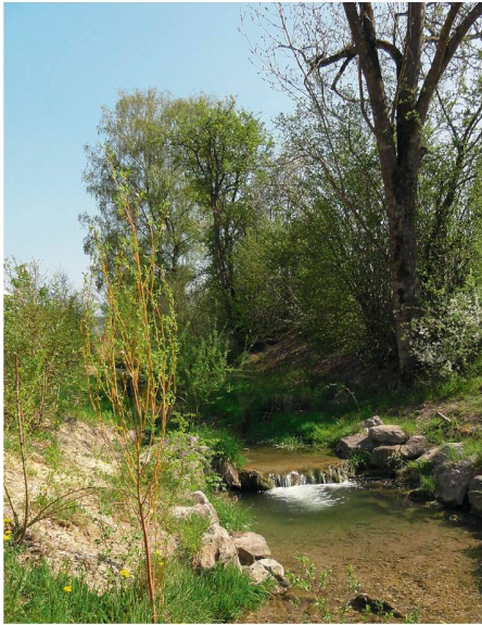
01 Mitarbeitende des Bülacher Forstbetriebs kümmern sich nicht nur um den Wald, sondern um den gesamten städtischen Grünraum

Die Stadt Bülach erhält den Waldpreis der Sophie und Karl Binding Stiftung für ihre vielseitigen Leistungen im Grün- und Umweltbereich. Besondere Aufmerksamkeit schenkt Bülach seit Jahrzehnten seinen Eichenwäldern.