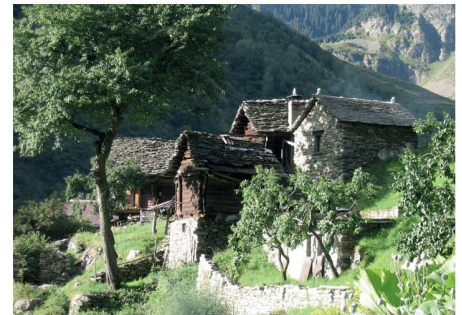
01 Rustici am Dorfrand von Madra im Val Malvaglia. Der Umbau von Rustici im Tessin erhält endlich eine gesetzliche Basis