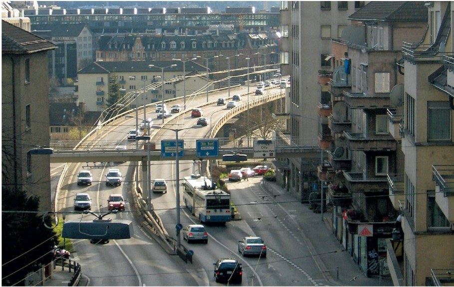
01 Die Rosengartenstrasse 2007, vor der Eröffnung der Westumfahrung. Seit der Eröffnung hat der Verkehr deutlich abgenommen. Anwohner fordern nun einen Rückbau auf zwei Spuren

Die Zürcher Westumfahrung ist offenbar effizient: Ein Jahr nach ihrer Eröffnung (vgl. TEC21 17/2009) hat der Verkehr in der Stadt Zürich nach Angaben der Dienstabteilung Verkehr der Stadtpolizei gegenüber 2008 um 20 % abgenommen. Auf der ehemaligen Transitroute, der «Westtangente», reduzierte sich der Verkehr sogar um beinahe 40 %. Nun fordern Anwohner einen Rückbau der Rosengartenstrasse.