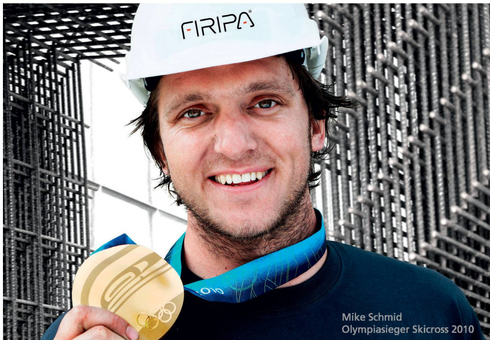
Mike Schmid Olympiasieger Skicross 2010