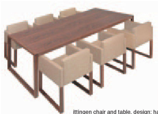
ittingen chair and table, design: harder spreymann, 2009