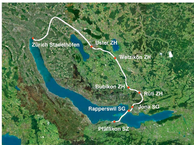
01 «S5-Stadt»: Der Bau der S5 gilt als einer der grundlegenden Faktoren für die rasche räumliche Entwicklung dieser Region. Mittlerweile verdichtet die S15 den Takt auf dieser Strecke (Plan: ETH Wohnforum – ETH CASE)