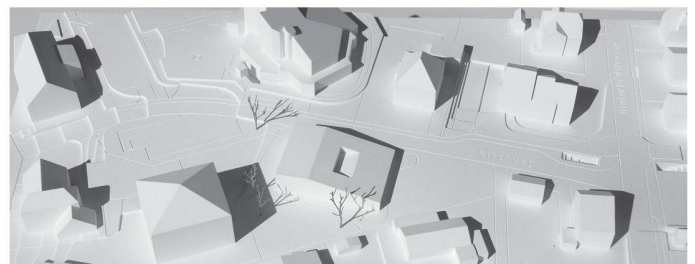
04 «Elmar»: Gefaltetes Dach