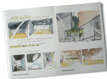
05 Steven Holl entwickelt seinen unterirdischen Entwurf aus Stockhausens «Stimmung»