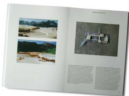
04 Caruso St. John Architects definieren den Ort durch eine archaisch anmutende Steinmauer

Der Jurybericht kann für 10 Fr. unter www.hochbau.sg.ch bestellt werden.