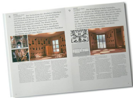
01 Die Bilder der introvertierten, Holzgetäferten Innenräume dienen Meili Peter Architekten als «gedankliches Diagramm»

Meili Peter Architekten gewinnen mit «neun Thesen und einer persönlichen Nachbemerkung» die Thesenkonkurrenz für das Klanghaus Toggenburg.