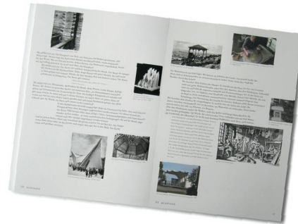
02 Miller & Maranta Architekten breiten ihre vielschichtigen Recherchespuren aus, ohne eine erkennbare Strategie zu formulieren

(af) Für die Planung des Klanghauses am Schwendisee – eines Orts für lokale und fremde Musikkultur – schrieb das Hochbauamt des Kantons St. Gallen mit einer Thesenkonkurrenz aus. Diese Art Studienauftrag soll keine Entwürfe, sondern Strategien erbringen. Dass Peter Zumthor teilnehmen würde, war nach der gerichtlich untersagten Direktvergabe des Auftrags (vgl. TEC21 48/2008) an ihn unwahrscheinlich. So wurden aus 60 Bewerbungen vier internationale und zwei Schweizer Architekturbüros aufgefordert, ihre Gedanken zum Bau eines Klanghauses auf zehn A4-Seiten zu präsentieren. Im Zentrum des etwa 1000m 2 grossen Baus soll ein Klangraum für Proben, Aufnahme, Forschung und Experiment stehen, der eine exzellente Akustik hat und über professionelle Aufnahmemöglichkeiten verfügt. Zur Annäherung an die recht abstrakt formulierte Wettbewerbsaufgabe wählten die beteiligten Teams sehr unterschiedliche Darstellungs-