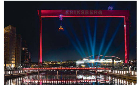
03 Göteborgs Stadterweiterung Västra Eriksberg

borg (S). In ihrer Begründung lobte die Jury Luzerns ausgeklügelte Anwendung von Beleuchtung zur Verwandlung von urbanem Erleben. Sie würdigte die gelungene Hervorhebung des Charakters der Stadt, während gleichzeitig Streulicht minimiert wird. Das südwestfranzösische Pau erhielt den zweiten Preis für die Ausleuchtung des historischen Schlosses, das heute als Museum genutzt wird. Der Ersatz für eine dreissig Jahre alte Beleuchtungsinstallation bringt laut Jury «überliefertes Erbe und Nachhaltigkeit in ein optimales Gleichgewicht». Die Göteborger Planenden zielten mit ihrem Projekt hingegen