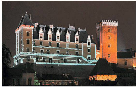
02 Château de Pau (F) aus dem 14. Jahrhundert

(af) Nach Genf, St. Gallen und Lachen erhält dieses Jahr Luzern den internationalen «city.people.light» Award. Der jährliche Wettbewerb wurde zum achten Mal in Folge von Philips und der Lighting Urban Community International Association (LUCI) organisiert. Aus 27 Eingaben von Stadtverwaltungen aus der ganzen Welt wählte die sechsköpfige Jury neben Luzern Ville-de-Pau (F) und Göte-