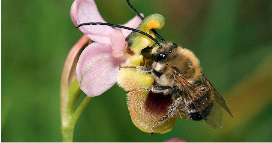
01 Die Langhornbiene ist das Tier des Jahres 2010. Sie zählt zu den rund 580 Wildbienenarten der Schweiz, von denen 45% auf der Roten Liste der gefährdeten und bedrohten Arten stehen

Im Jahr 2002 beschlossen die 193 Mitgliedsstaaten der Konvention über die biologische Vielfalt (CBD), den Verlust der Biodiversität bis 2010 signifikant zu reduzieren. Die Uno rief daher das Jahr 2010 zum Internationalen Jahr der Biodiversität aus. Im Oktober wurde nun im japanischen Nagoya an der Vertragsstaatenkonferenz über die biologische Vielfalt Bilanz gezogen.