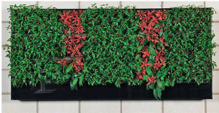
01 Grafisches Motiv mit Akzenten

Das Institut für Umwelt und natürliche Ressourcen der Zürcher Hochschule für Angewandte Wissenschaften (ZHAW) hat ein System für vertikale Innenraumbegrünungen entwickelt. Das Besondere: Das lebende Bild kommt ohne Pumpe, Wasser- und Stromanschluss aus.