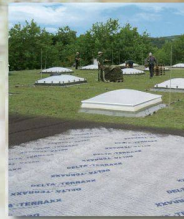
DELTA-TERRAXX Hochwertiges Schutz- und Drainagesystem

Wer optimale Flächendrainung und perfekten Grundmauerschutz anstrebt, kommt an den DELTA®-Noppenbahnen aus dem Hause Dörken nicht vorbei. Für alle Objekte im Hoch-, Tief- und Ingenieurbau bieten sie eine hohe Sicherheit vor Feuchtigkeit. Von der Standard- bis zur innovativen High-Tech-Anwendung: Das DELTA®-Noppenbahn-Programm ist so vielseitig wie Ihre Anforderungen. Die Dörken-Experten beraten Sie gern persönlich, welche Bahn für Ihr nächstes Projekt massgeschneidert ist. Vereinbaren Sie gleich einen Gesprächstermin!