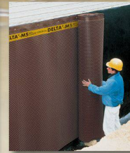
DELTA-MS Sauberkeitsschicht, Grundmauerschutz und Sickerschicht