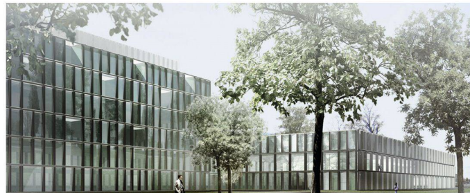
15 «Seehenswürthigkeit»: Drei Baukörper unterschiedlicher Proportion und Nutzung formen ein Gebäudeensemble. Geneigte, bronzierten Kastenfenster kreieren ein Licht- und Schattenspiel (Dietrich/Untertrifaller)