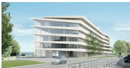
17 «Sequenz»: Der Bau ist als Solitär in den Park platziert und reagiert mit präzise gesetzten Knicken auf seine Umgebung (Tilla Theus und Partner)