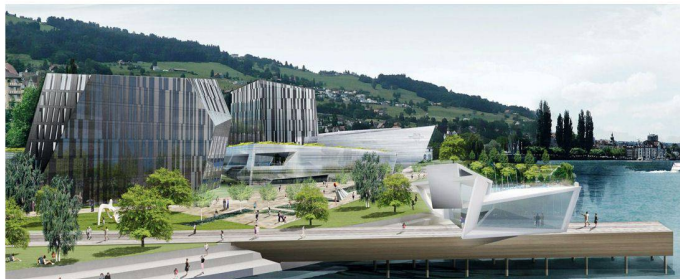
14 «Ankergrund»: Zwei Gebäudeskulpturen sind im 1. Obergeschoss über das Foyer verbunden. Die Gebäudehülle besteht aus opakem Naturstein und transparenter Verglasung (Architekt Daniel Libeskind)