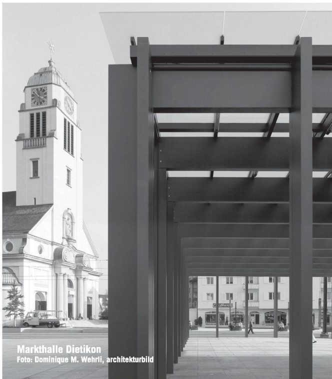
Markthalle Dietikon

Partner für anspruchsvolle Projekte in Stahl und Glas