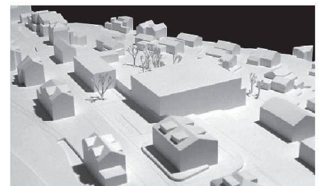
01 «Avitus» (Gähler Architekten): viergeschossiger Haupt- und dreistöckiger Nebenbau mit ebenerdiger Verbindung