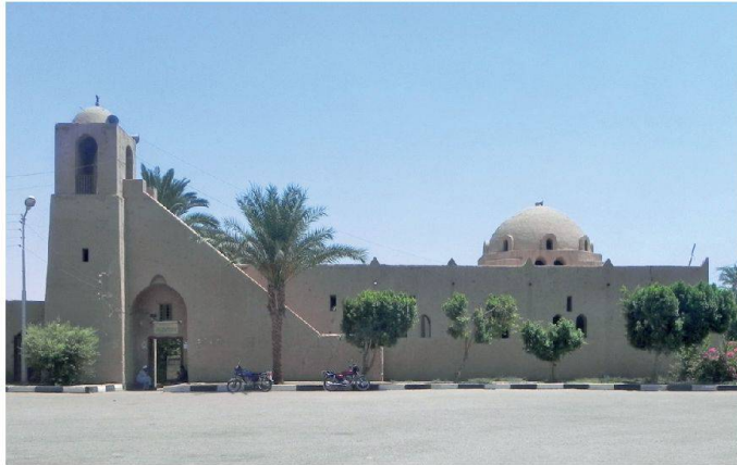
01 Heutiger Zustand des Zentrums von New Gourna mit dem formal integrierten Minarett und der Moscheekuppel