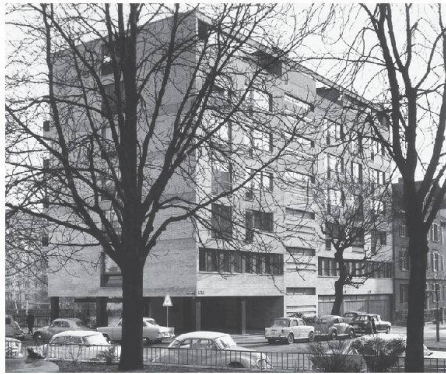
01 Büro- und Geschäftshaus Seefeldstrasse 152, Zürich (1957–1960)

Am 27. November 2010 starb Jakob Zweifel im Alter von 89 Jahren in Zürich. Er zählt zu den interessantesten und umtriebigen Architekten der Schweizer Nachkriegsmoderne.