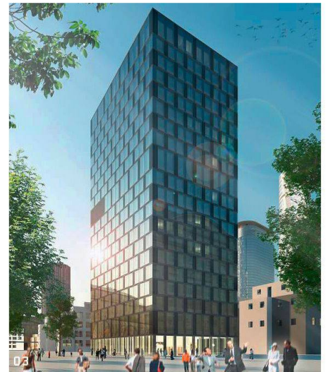
01 «Bahnorama»: höchster Holzturm Europas (66.72m) (Foto: ÖBB, A-Wien); 02 «Metropol Parasol», Sevilla: begehbare, 28m hohe Holzschirme (Foto: Jürgen Mayer H. Architekten, D-Berlin); 03 «LifeCycle Tower»: 20-geschossiges Holzhochhaus (Bild: Hermann Kaufmann, A-Schwarzach)

Das 16. internationale Holzbauforum lockte diesmal etwa 1300 Holzbauinteressierte nach Garmisch-Partenkirchen. Doch nicht nur die Veranstaltung wächst, auch die Projekte werden komplexer, grösser und höher.