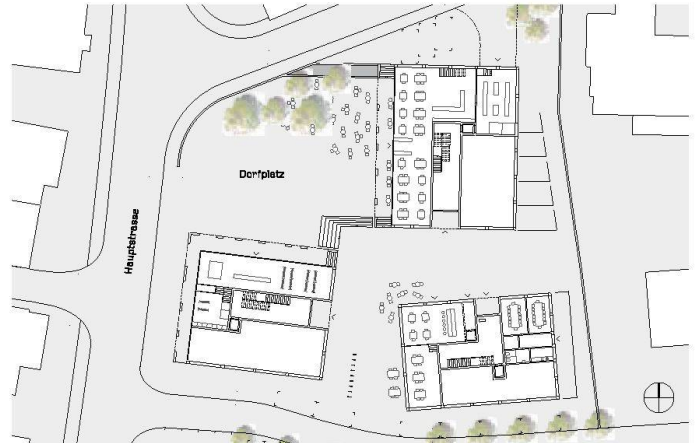
01+02 «Ring»: ein Grundstück – vier Quadranten, drei davon mit Gebäuden besetzt und einer als Platz freigehalten (Visualisierung + Plan: Verfassende)

Das Team Peter Luechinger Architektur/Fortimo Invest gewinnt den Investorenwettbewerb für die neue Zentrumsüberbauung in Goldach mit drei im Ortsbild verankerten Baukörpern.