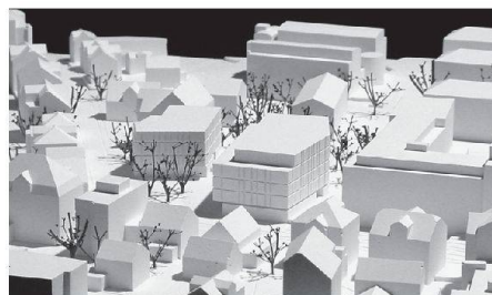
04 «Passeggiata»: zwei konische Bindeglieder