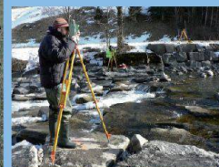
Vermessung der Gerinnesohle für hydraulische Berechnungen

Beihilfe bei der Auslegung des seismischen Messnetzes