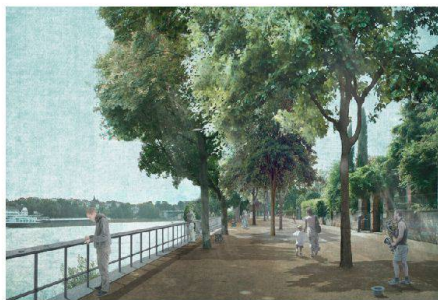
05 «Confluo»