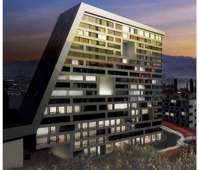
Hochhaus uptown in Zug Architektur: Scheitlin-Syfrig+Partner Architekten AG, Luzern

Weitblickende Architekten bauen auf Alphabeton-Stützen