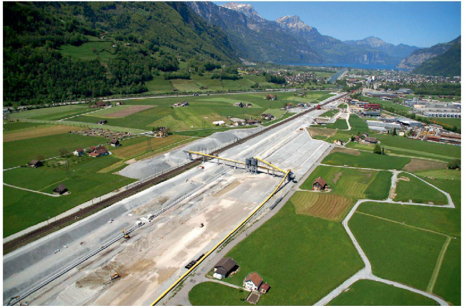
02 Der Zulauf zum Gotthardbasistunnel im Urnerboden. Nach der Inbetriebnahme steht die Schweiz vor grossen Herausforderungen im Bereich der Infrastruktur-, der Raum- und Verkehrsentwicklung

Die europäische Eisenbahn-Nord-Süd-Verbindung von Rotterdam nach Genua ist eine Hauptschlagader des europäischen Eisenbahnnetzes, die über Jahrhunderte gewachsen ist. Über 1200 km verbindet sie die grossen Nordseehäfen in Belgien und den Niederlanden mit Deutschland, der Schweiz und den prosperierenden Wirtschaftszentren Oberitaliens sowie dem italienischen Mittelmeerraum. Der beabsichtigte Ausbau der als «Korridor 24» bezeichneten Verbindung zielt vor allem darauf ab, den grenzüberschreitenden Personen- und Güterverkehr attraktiver zu machen und – namentlich aus Schweizer Sicht – den alpenquerenden Güterverkehr von der Strasse auf die Schiene zu verlagern. Herzstück dieser Anlage sind die Flachbahnen durch die Alpen (Neat). Allein in der