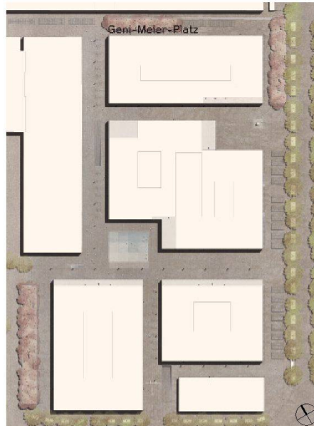
01–04 Zur Weiterbearbeitung «dr Eskimo» (Andreas Geser Landschaftsarchitekten): 1. Etappe (links) mit Resten des Zauns um das Zeughausareal und zentral gelegener Brachfläche (Zeughausgarten). Zustand nach der 2. Etappe (rechts) (Visualisierungen + Pläne: Projektverfasser)

Andreas Geser Landschaftsarchitekten aus Zürich gewinnen den Projektwettbewerb für die Aussenraumgestaltung des künftigen Verwaltungszentrums am Guisanplatz in Bern.