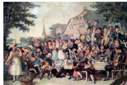
01 Schallplattencover der Aufnahme

Informationen: www.espazium.ch/tec21/article/echo-als-akustisches-spiegelbild