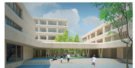
08 «Gartenhof» (Froelich & Hsu Arch.): Aus fünf Gebäuden entsteht eine dichte Folge unterschiedlicher Aussenräume. Im Erdgeschoss verbindet eine durchgehend überdachte Erschliessungsfläche die Baukörper miteinander