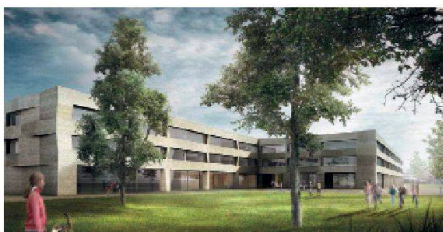
10 «FlipFlop» (Berrel Berrel Kräutler Arch.): In der Schnittstelle erzeugen zwei dreigeschossige, versetzt angeordnete Kuben durch die mittige Setzung im Gelände zwei fast gleichwertige Freiräume im Norden und Süden