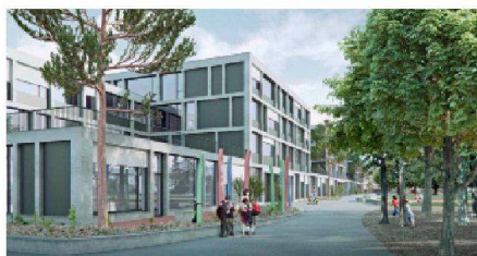
07 «Gartenhöfe» (werk1): Die heterogene, ein- bis viergeschossige Struktur orientiert sich an der Bebauung des nahen Gewerbegebiets. Die versetzten Volumen erzeugen in den Obergeschossen eine mäanderförmige Erschliessung