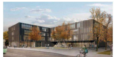
09 «4 hoch 3» (Phalt Arch.): Ein kompakter, dreiflügliger Baukörper ermöglicht eine Konzentration der Aussenräume. Zentrum der Anlage ist die abgesenkte Turnhalle, deren Dachfläche als Sport- und Pausenbereich dient