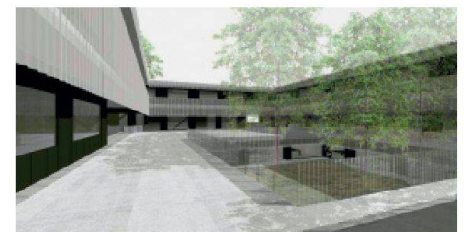
12 «Hortus» (Schmid Kuepfer Arch.): Das kompakte, zweigeschossige Gebäude ist vorwiegend auf den Innenhof orientiert, was durch die umlaufende Fassade aus gelochten Wellbandprofilen noch betont wird