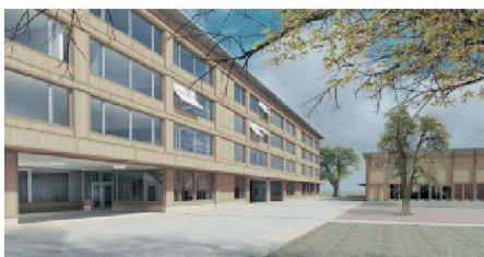
06 «Klara» (Bienert Kontat Arch.): Eine Achse zwischen den zwei parallelen länglichen Baukörpern erschliesst das Areal. Die Klassenräume reihen sich entlang der Längsfassaden, Nischen in den Gängen lockern die lineare Struktur auf