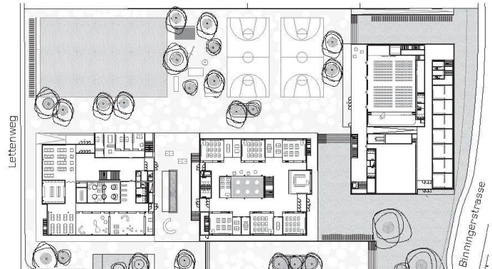
01 + 02 «Regenbogen» (ARGE Birchmeier Uhlmann/Carlos Rabinovich): Vorplatz der neuen Schule mit schillernden Metallfassaden, Grundriss EG

Die ARGE Birchmeier Uhlmann und Carlos Rabinovich Architekten gewinnen den offenen Wettbewerb für ein neues Schulhaus in Allschwil BL mit einem städtebaulich überzeugenden und übersichtlichen Konzept.