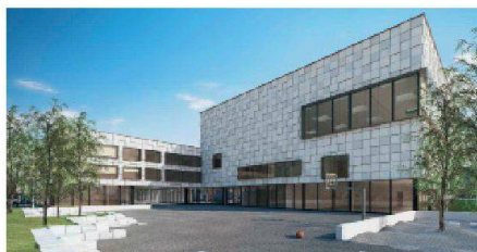
11 «Pixi» (Dorenbach Arch.): Drei Baukörper sind übereck miteinander verbunden – die Oberstufe im Süden, die Tagesschule mit Unterstufe im Norden und dazwischen die Aula, die Schulleitung sowie die Turnhalle im 2. OG